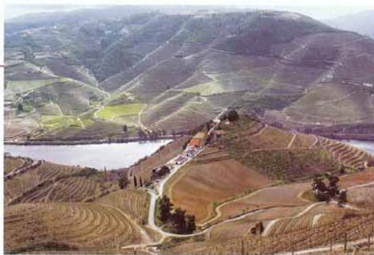
O Xisto é vinificado na Quinta do Crasto mas os vinhos são bem diferentes.

O vinho do Porto está, de facto, muito longe das actuais prioridades de Jean-Michel Cazes. Hoje, o negócio vitivinícola da família Cazes está entregue ao filho Jean-Charles (inclui, para além de três Châteaux em Bordéus, adegas em Chateaufort-du-Pape, Languedoc e Austrália, para além de empresas de distribuição). Jean-Michel, agora com mais tempo livre, dedica-se a reconstruir e reabilitar a pitoresca aldeia de Bages (é cativante o entusiasmo com que mostra as fotografias e fala da padaria que